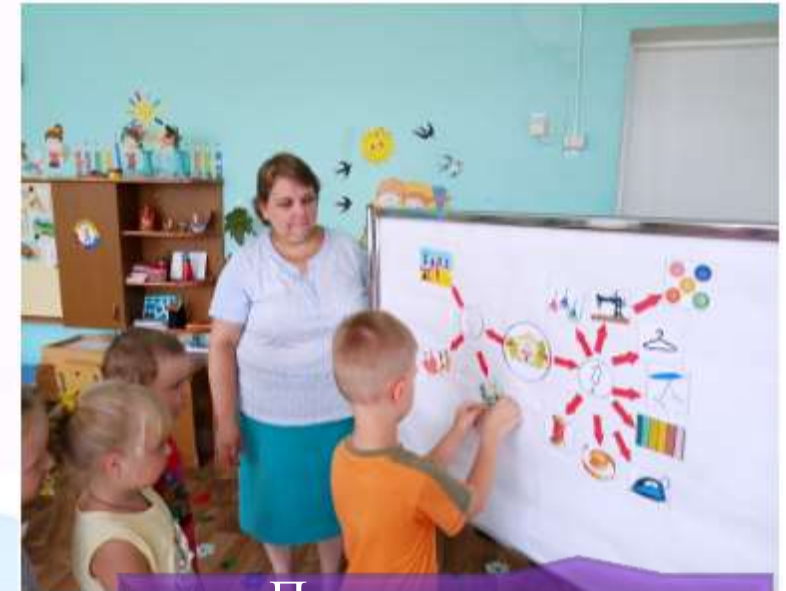
Познавательно- исследовательская деятельность