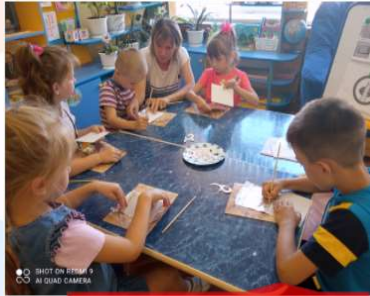
Продуктивная творческая деятельность